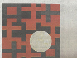
Olle Borg, "XX III/III", olja och aluminiumfärg på aluminium.